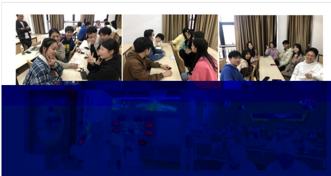
同学们在课堂实训场景