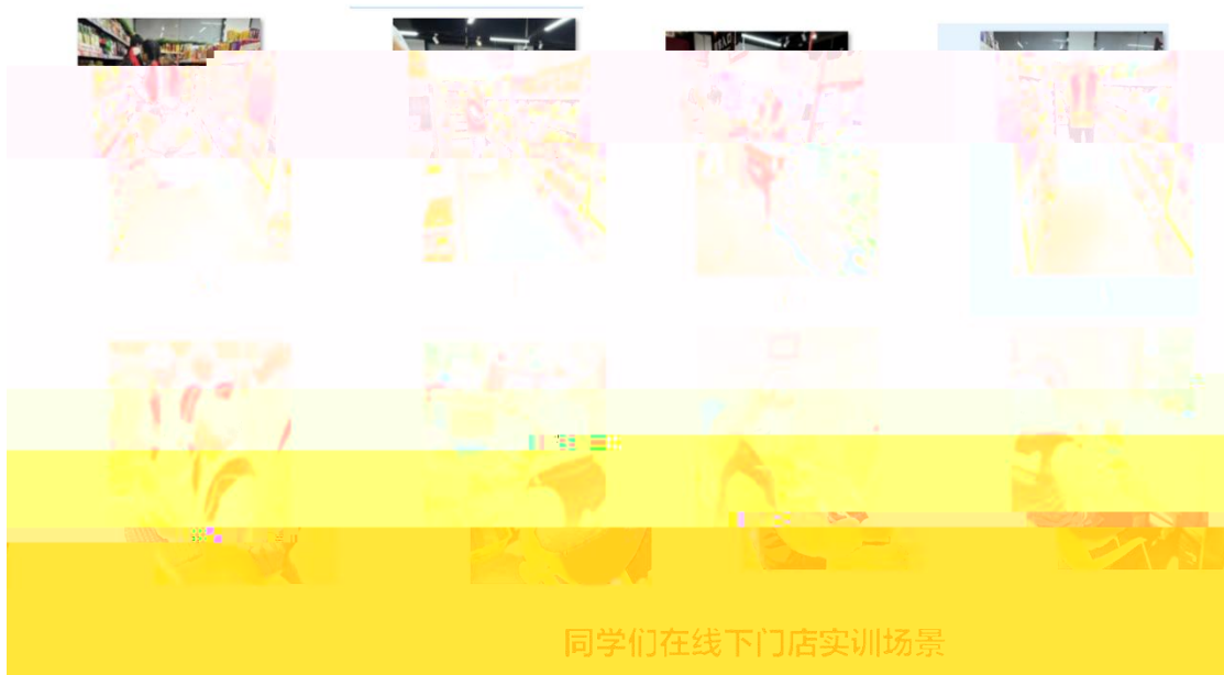
同学们在线下门店实训场景